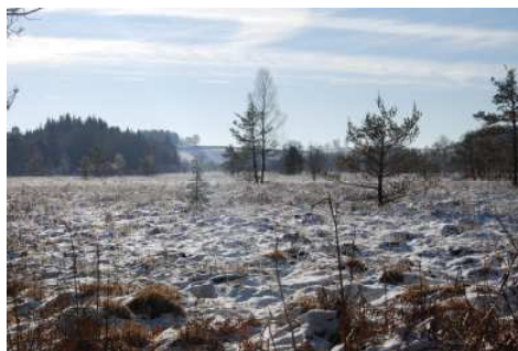
Tourbière sous la neige