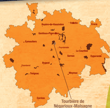
Tourbière de Négarioux-Malsagne