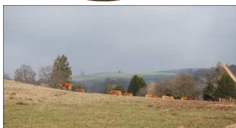
Pâturage bovin sur des parcelles contractualisées en MAET