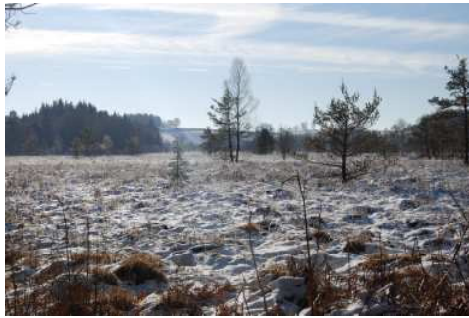
Tourbière sous la neige