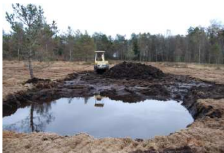
Creusement de gouilles (Contrat Natura 2000 CEN Limousin)

Depuis 2008, des actions d'entretien permettent de maintenir les habitats en bon état de conservation en lien avec les activités en présence (agriculture, sylviculture...)